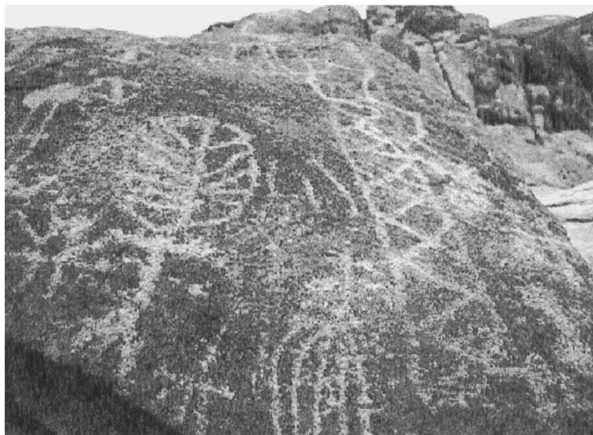
Figura 2. Petrograbados.