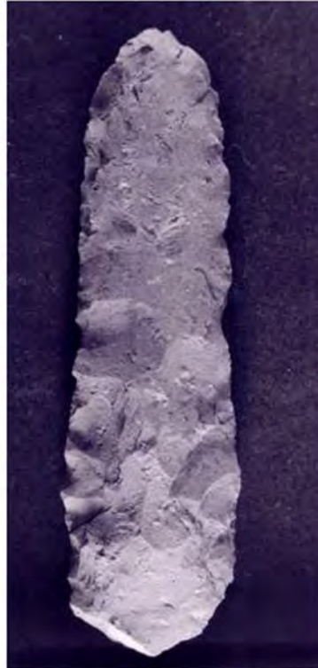
Figura 5. Cuchillos: (izquierda) sitio A104; (derecha) sitio A115.