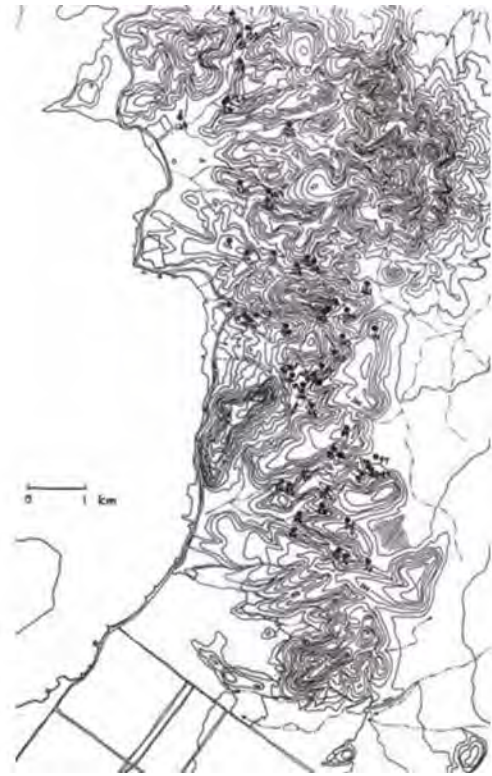
Figura 1. Mapa de La Paz con la distribución de sitios arqueológicos.

de esta clase. La fuente de agua potable es arroyos. En ocasiones se conserva el agua dulce en pozas o tinajas.