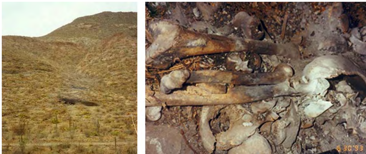
Figura 4. Cueva La Enfermería.