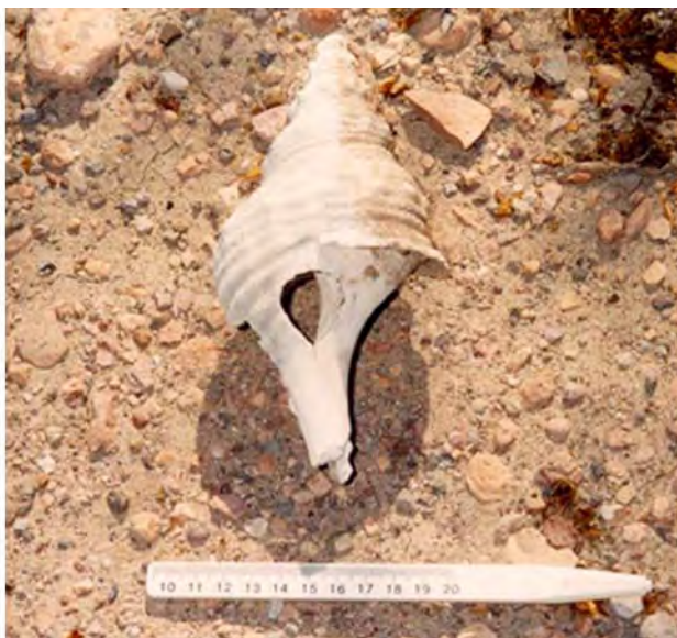
Figura 8. Fasciolaria princeps , sitio A117.

define Binford y que corresponde a recolectores y no forrajeros. Hasta el momento tenemos un sitio funerario del periodo tardío perteneciente a Las Palmas y probablemente la cantera-taller del sitio A104 también, aunque es posible que fuera explotado desde el periodo medio.