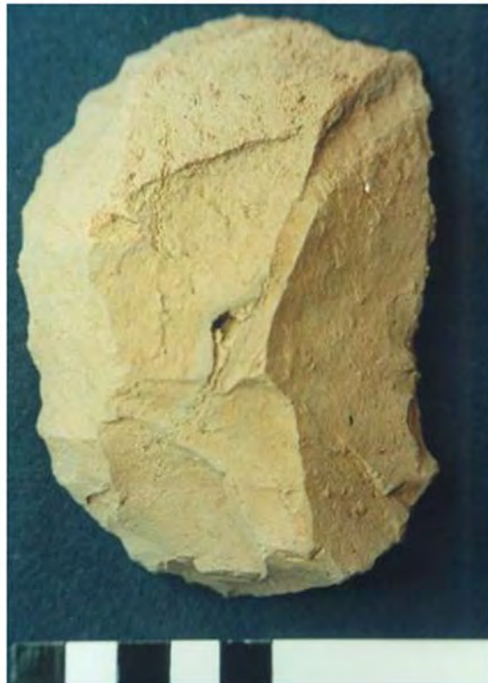
Figura 6. (izquierda) sitio A93, raspador; (derecha) sitio A80, raedera.