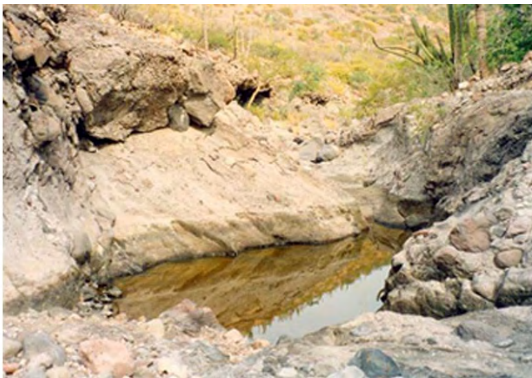
Figura 3. Sitio A119, tinaja.