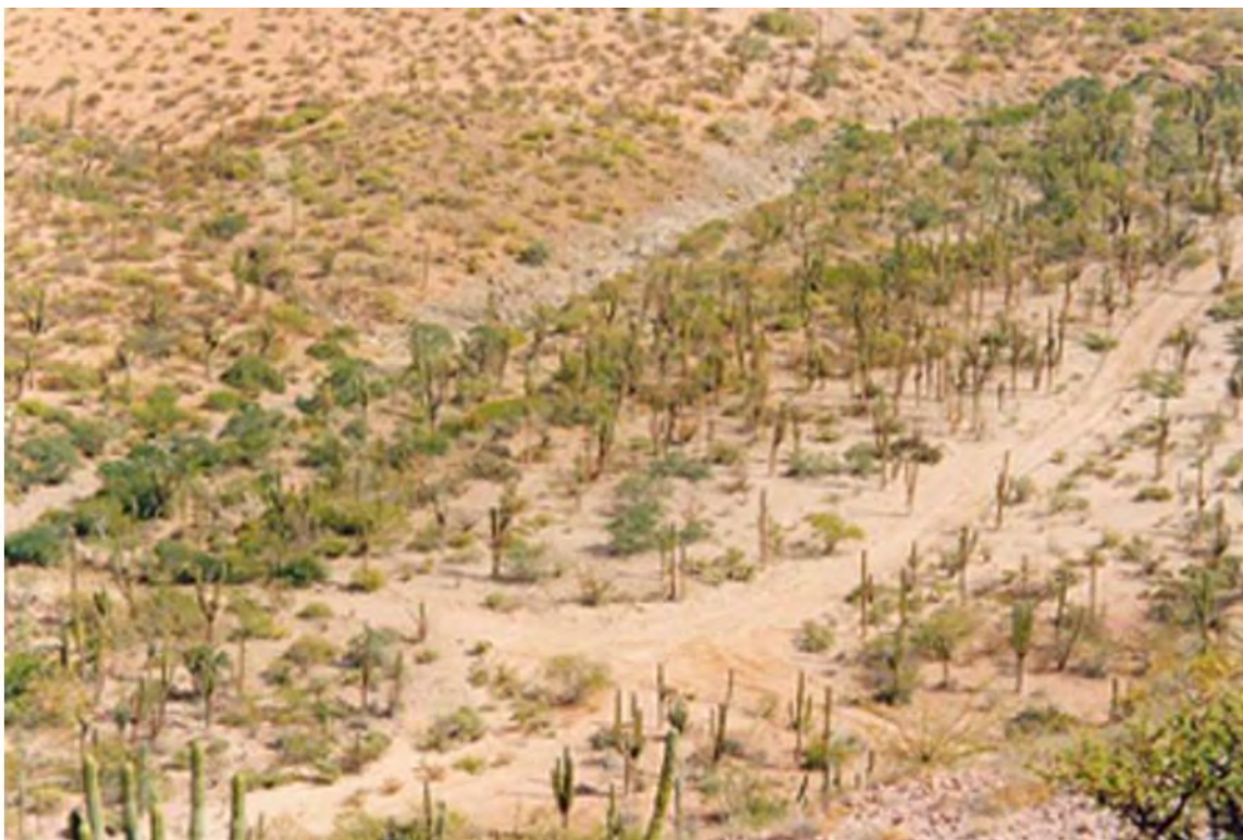
Figura 2. Sitio A117.