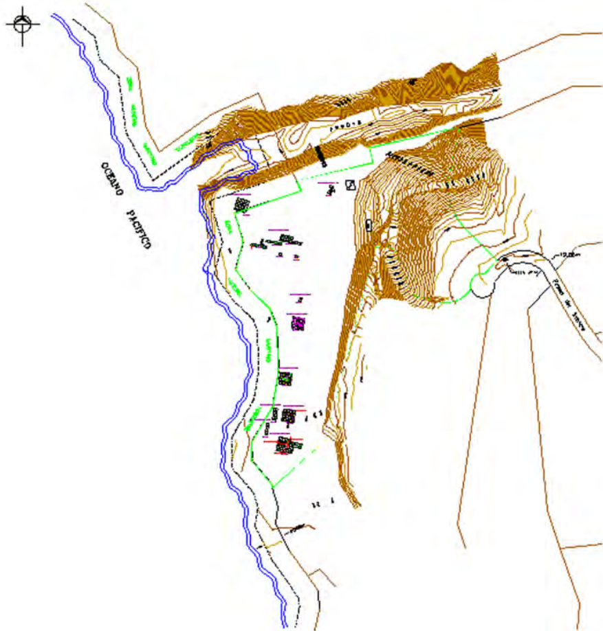
Figura 3. Áreas de excavación.