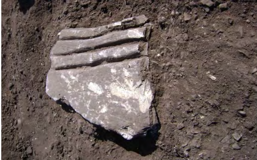
Figura 10. Tabla ceremonial.