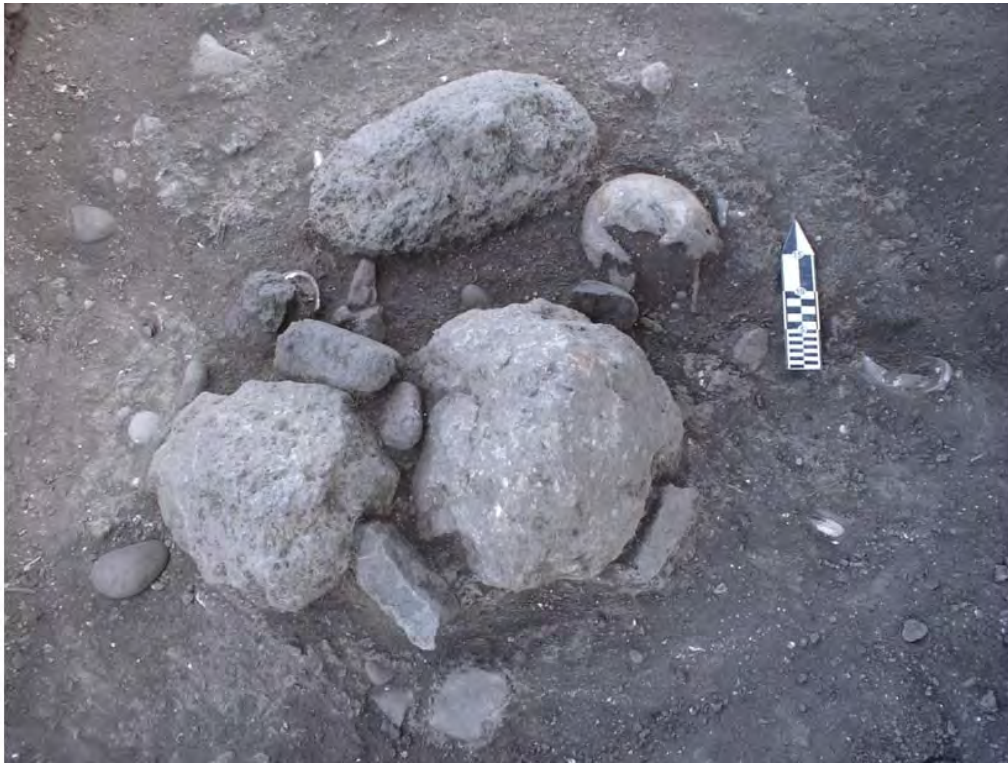
Figura 5. Entierro #1.