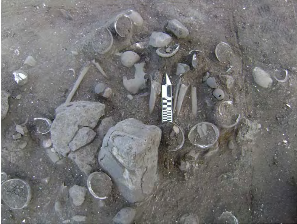
Figura 8. Entierro #5.