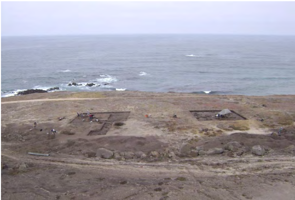
Figura 9. Momento II: área 1 (izquierda) y área 2 (derecha).