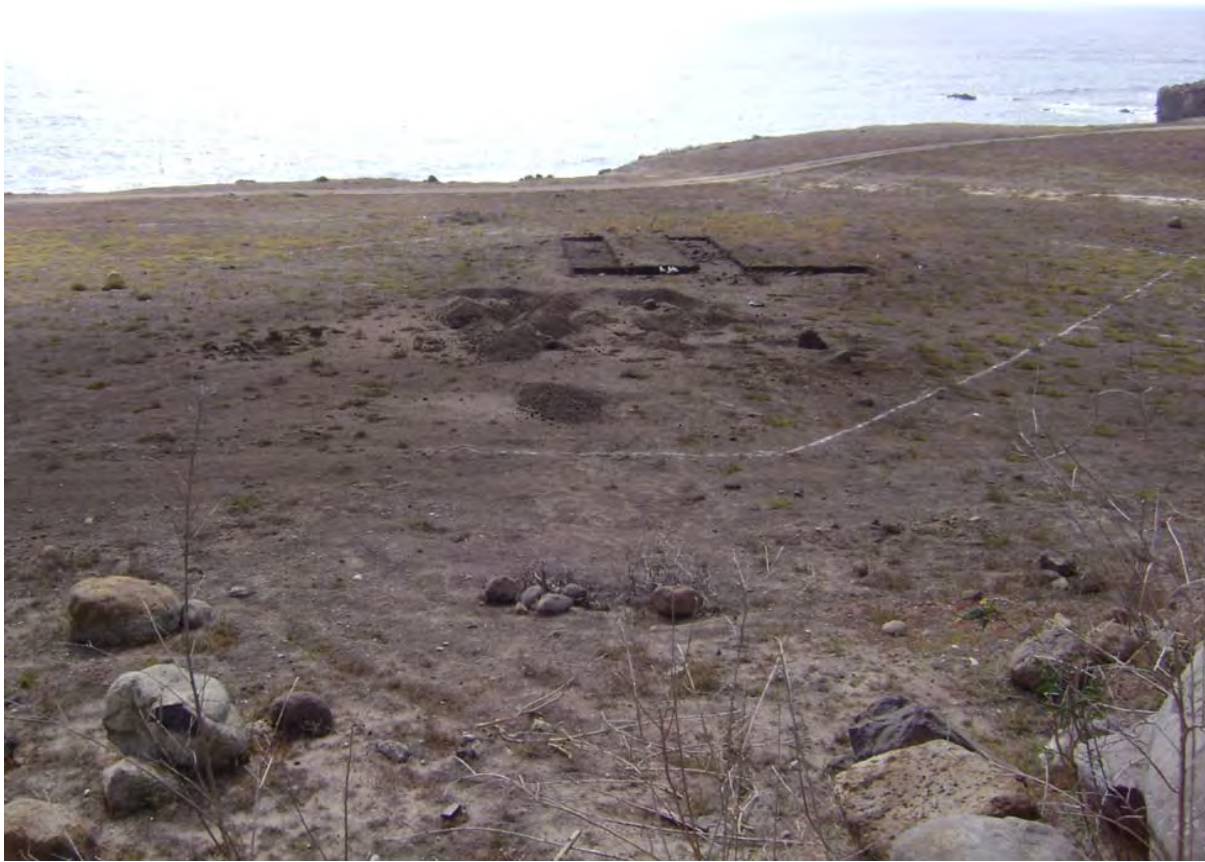
Figura 12. Área 3, momento II de excavación.

momentos de ocupación en el área, con elementos arqueológicos de fogones y una oquedad en el subsuelo producto de una modificación fuerte al entorno cuya función primordial no sabemos todavía (Figura 12). Las especies de conchas identificadas son 19 y la diversidad y cantidad de fauna en esta área es menor que las dos áreas anteriores.