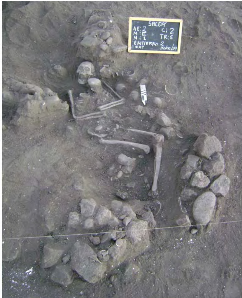
Figura 11. Entierro #2.