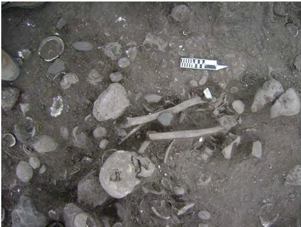
Figura 6. Entierro #3.