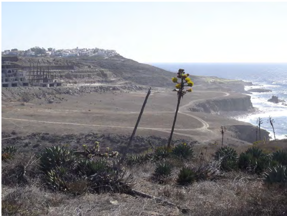
Figura 2. Sitio La Punta.