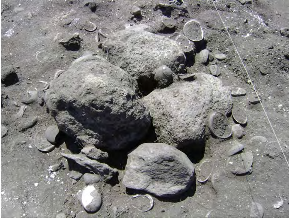
Figura 7. Entierro #4.

(Figura 8). Las ofrendas consistían en concha trabajada, un peso de red, un metate y una mano de molienda.