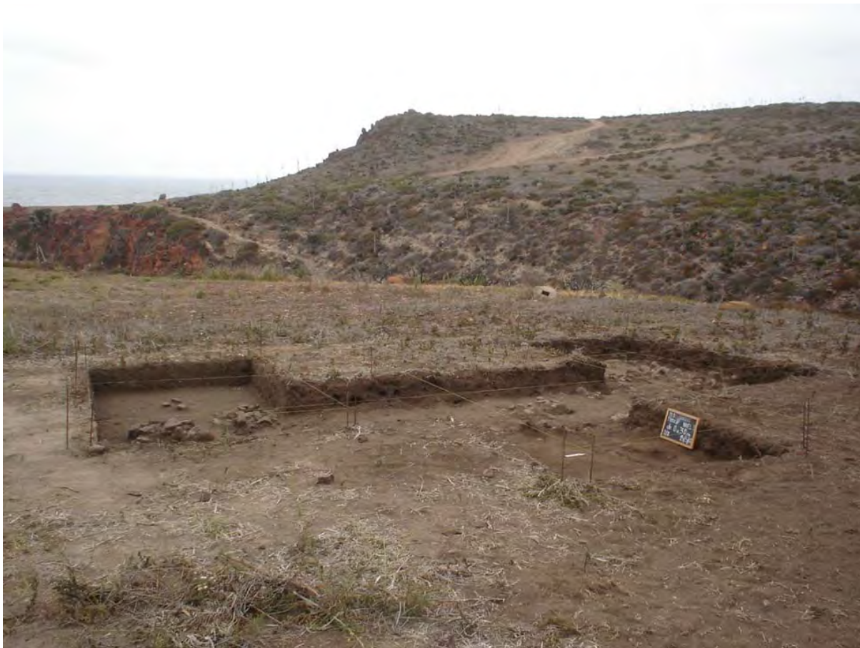
Figura 4. Excavaciones en Momento I, Campamento 8.

Se identificaron 23 especies de conchas y una gran diversidad de restos de fauna, como lobos marinos, nutrias, tiburón, ballena, mantarraya, muchos peces, venado, conejos, aves, etc.