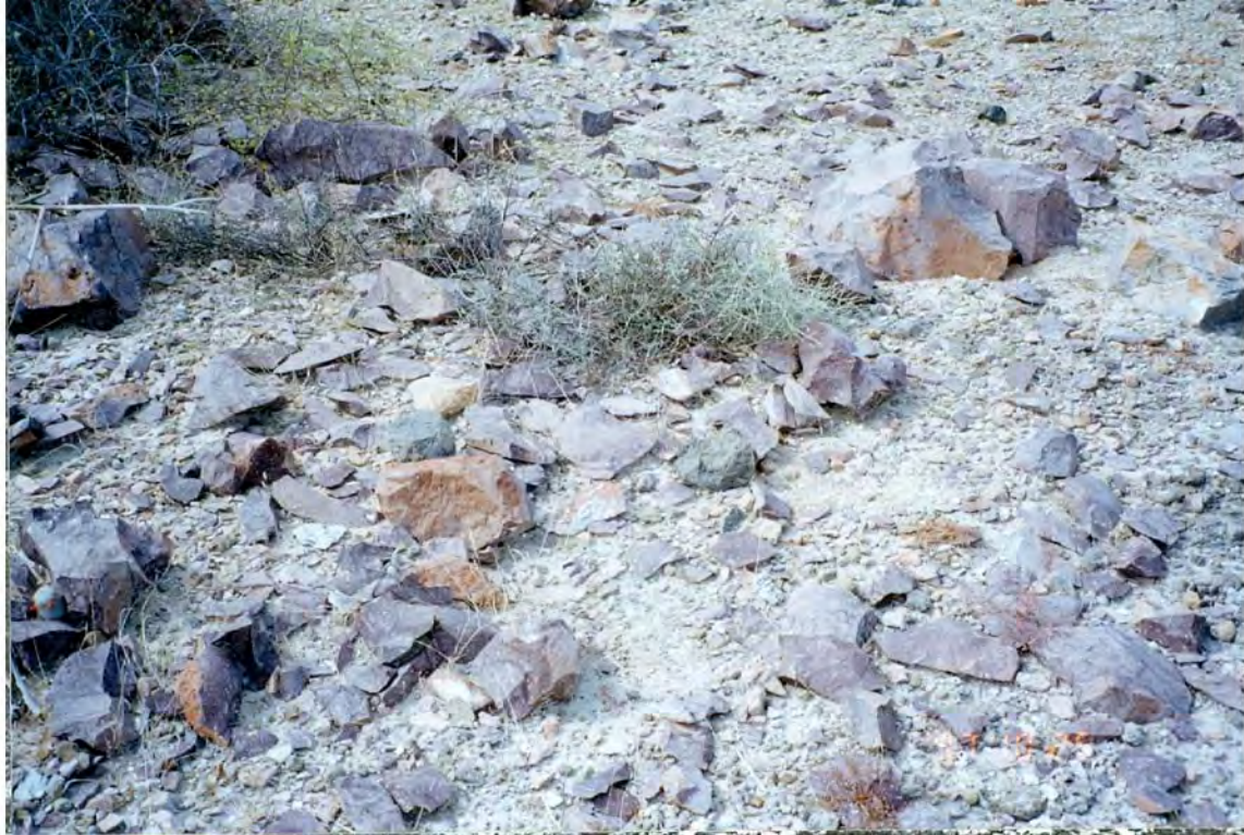
Figura 2. Un taller lítico de riolita del sitio A-16 El Pulguero Suroeste.