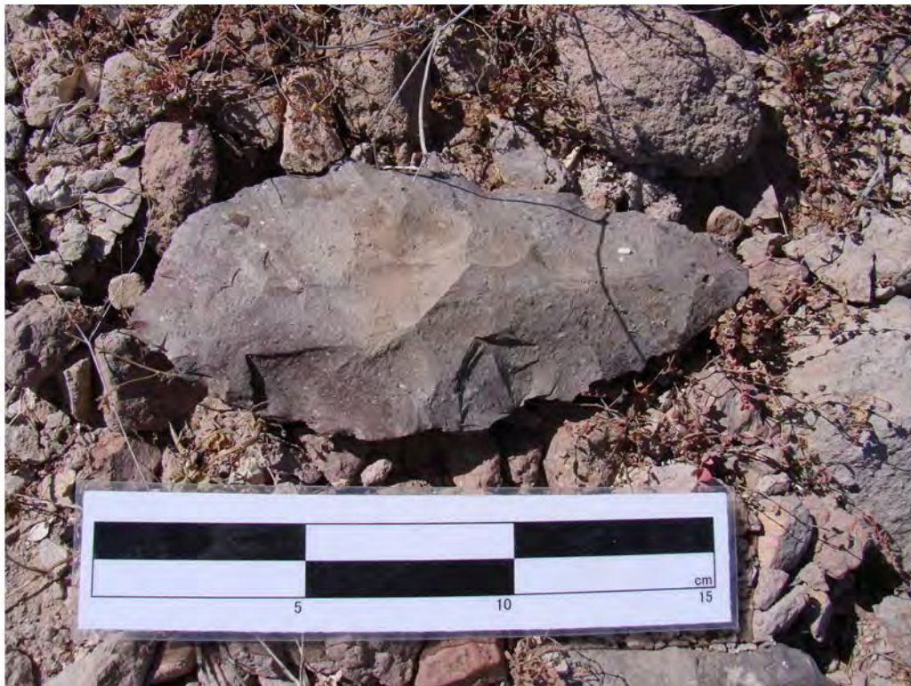
Figura 3. Una preforma de bifacial del sitio A-16 El Pulguero Suroeste.