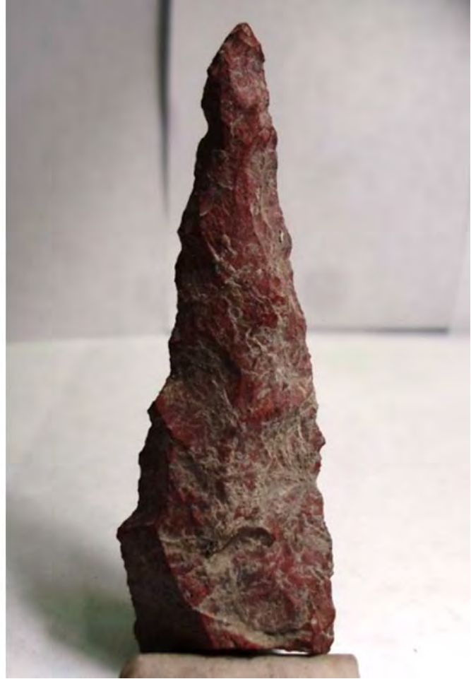
Figura 7. Buril (izquierda) y perforador (derecha).

extraídas sobre el cortex plano. Hay núcleos con una sola plataforma y otras con dos. La mayoría de las macronavajas parecen haber sido destinadas para elaborar cuchillos bifaciales. En caso de que las navajas salieron más gruesas que otras, se destinaron para manufacturar raspadores y raederas. En caso de los perforadores, las navajas obtenidas son más angostas que otras. En caso de la mayoría de las puntas de proyectil, no se pudo identificar si estas fueron manufacturadas sobre lascas o navajas porque se encontraron fragmentos de ellos. Por otra parte, hay herramientas talladas que fueron manufacturadas sobre las lascas, tales como los raspadores circulares.