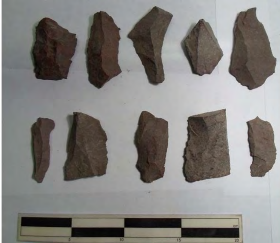
Figura 7. Navajas.