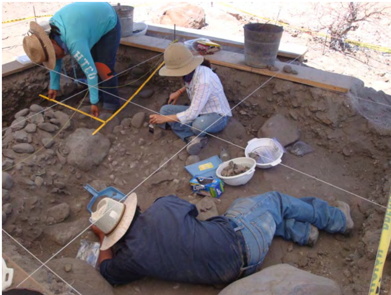
Figura 2. Proceso de excavación en el sitio A56 Cerro de la Calavera #1.