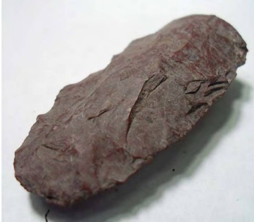
Figura 5. Cuchillo tipo Calavera.