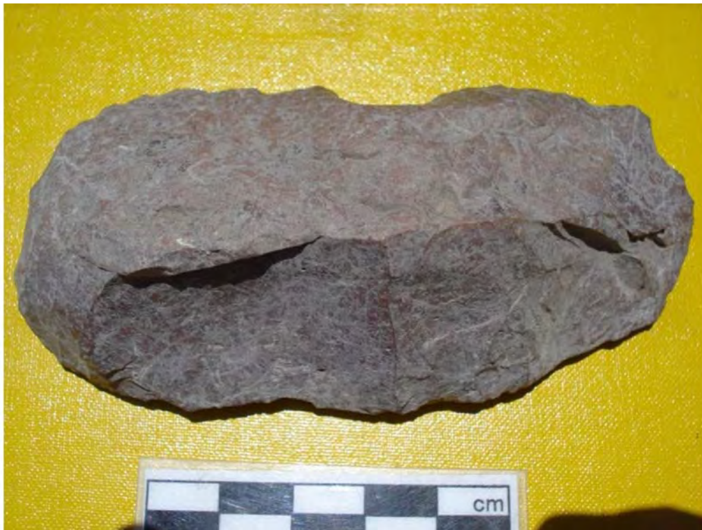
Figura 6. Raspador.