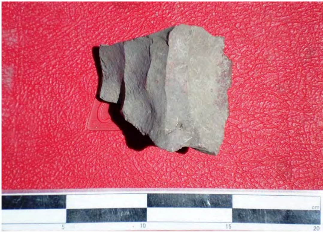
Figura 8. Núcleo de navajas.