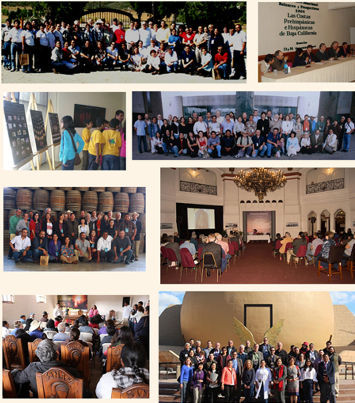
Figura 2. Fotos de las reuniones de “Balances”. Superior izquierda a inferior derecha: Tecate 2003, Rosarito 2004, Mexicali 2009, Ciudad de México 2006, Ensenada 2018, Ensenada 2015, San Antonio Necua 2016 y Tijuana 2019.