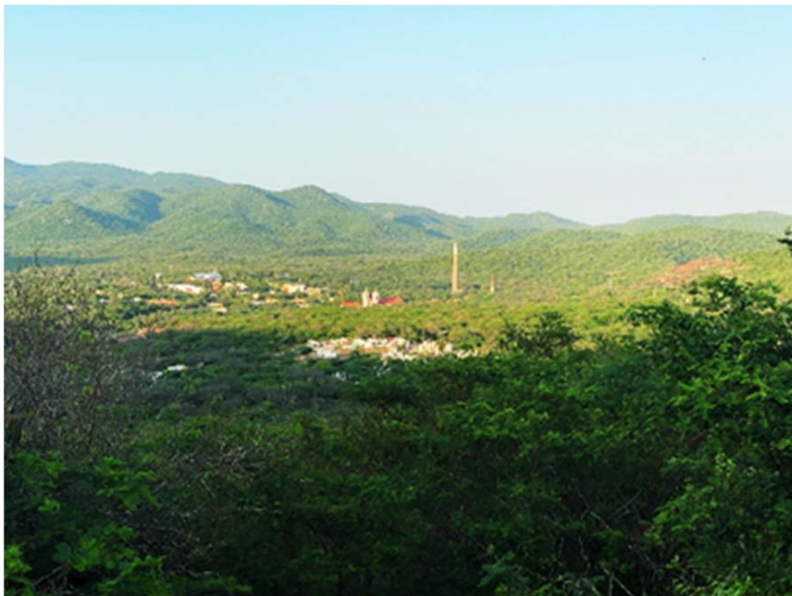
Figura 1. Vista general de El Triunfo.

en el que fueron utilizados. Lamentablemente, en Baja California Sur la zona histórica de estos lugares presenta, por lo general, un notable grado de deterioro a consecuencia de diversas razones: medio ambiente; flora y fauna; fenómenos meteorológicos; y en algunos casos, daños por actos de vandalismo o saqueo.