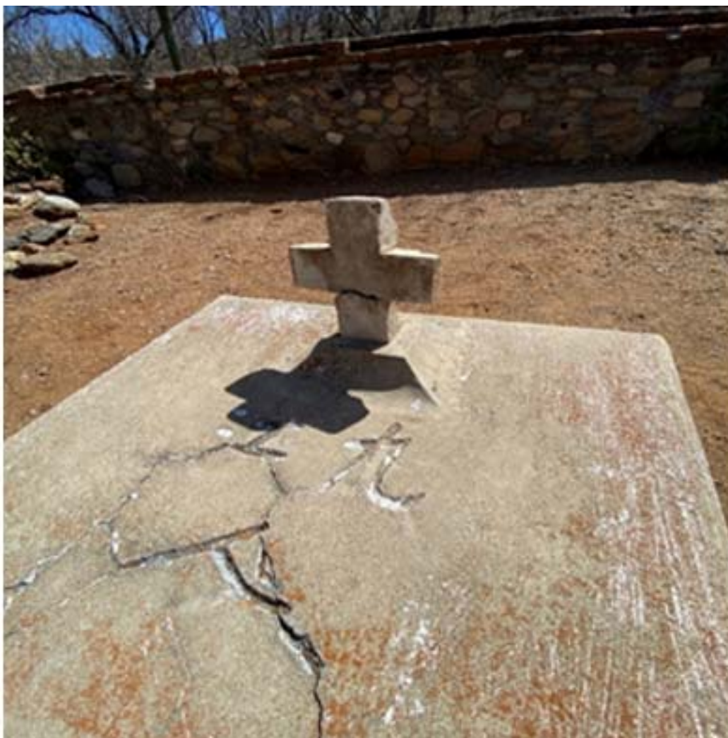
Figura 6. Tumba con inscripción china. Panteón Chino, El Triunfo B.C.S.

ocupación del cementerio a través del tiempo o con algunos de los eventos ocurridos en el período, como epidemias, desastres naturales o accidentes de la mina. Pero, en este nivel de la investigación no hay aún elementos suficientes para una interpretación más profunda de estos datos.