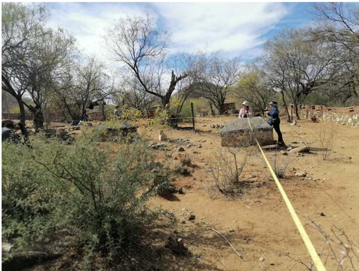
Figura 5. Medición y toma de datos en Panteón Chino, El Triunfo B.C.S.

condiciones actuales del lugar; tomar apuntes generales sobre el entorno geográfico, y la distribución y características de los monumentos históricos en el área de estudio.