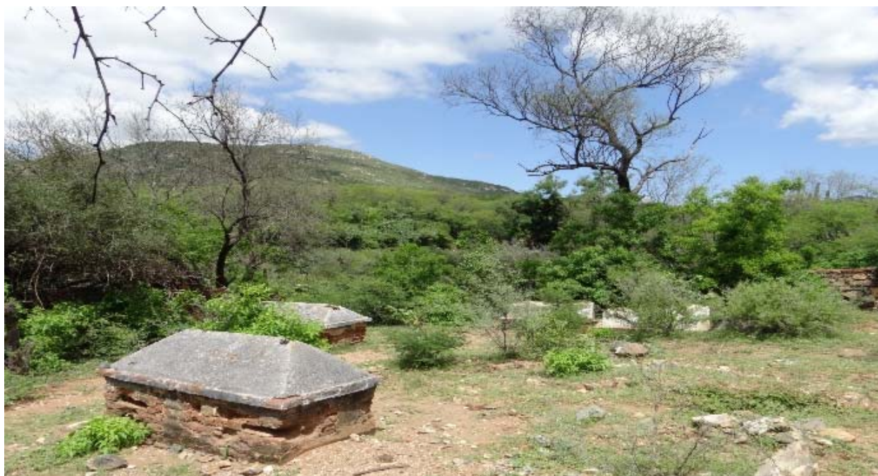
Figura 3. Vista general de El Panteón Chino.

probable que el nombre se fuera fijando con el tiempo, relacionado con las tumbas con caracteres chinos que se encuentran en él y al conocimiento de la migración china documentada desde finales del siglo XIX, de quienes aún quedan algunos descendientes en la región (Preciado 2002).